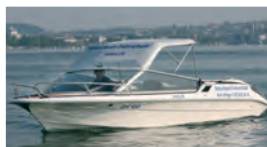
Im Winter geheizte Boote

Ganzjahresbetrieb Zürich- und Obersee Theoriekurs jeden Dienstag Kategorie A+D