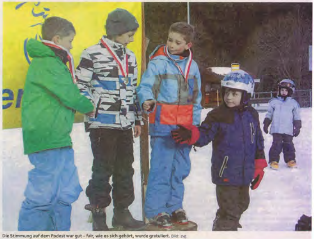
Die Stimmung auf dem Podest war gut – fair, wie es sich gehört, wurde gratuliert.