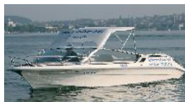
Im Winter geheizte Boote

Ganzjahresbetrieb Zürich- und Obersee Theoriekurs jeden Dienstag Kategorie A+D